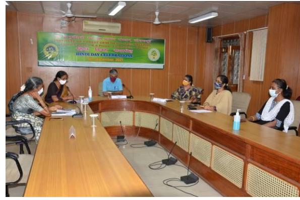
समूह समन्वयक (अनुसंधान) के द्वारा भाषण