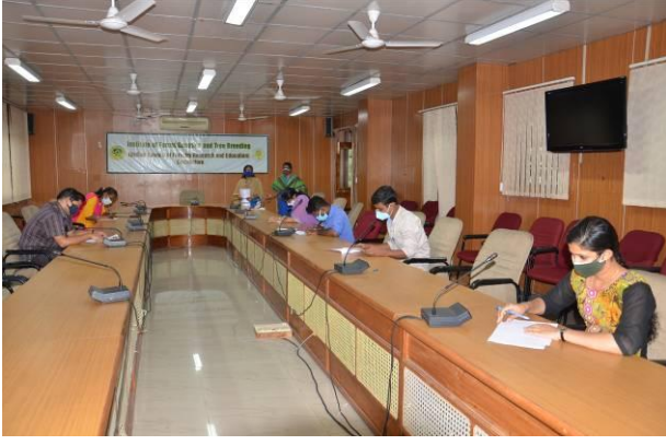
प्रशासनिक शब्दावली प्रतियोगिता