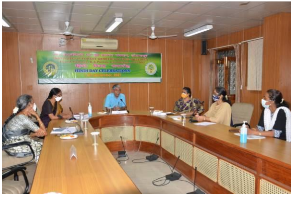
निदेशक जी का भाषण