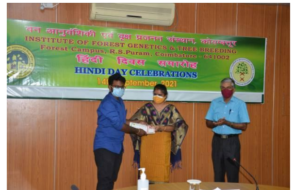
विजेताओं को पुरस्कार देते हुए