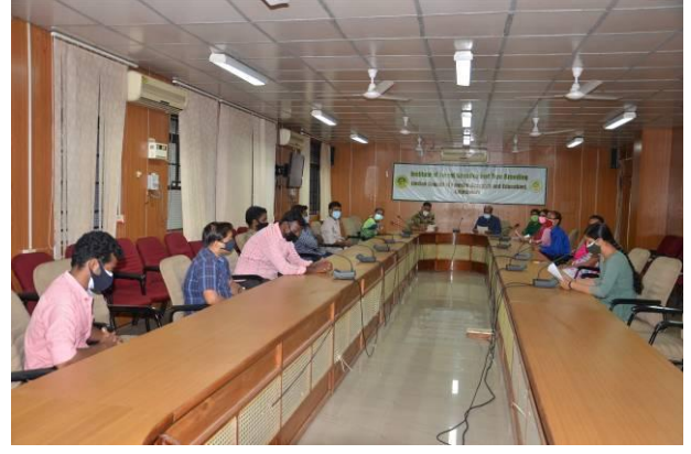
हिंदी वाचन प्रतियोगिता