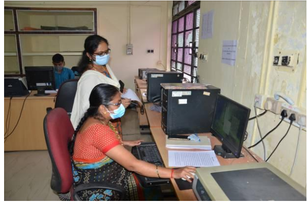
हिंदी टंकण प्रतियोगिता